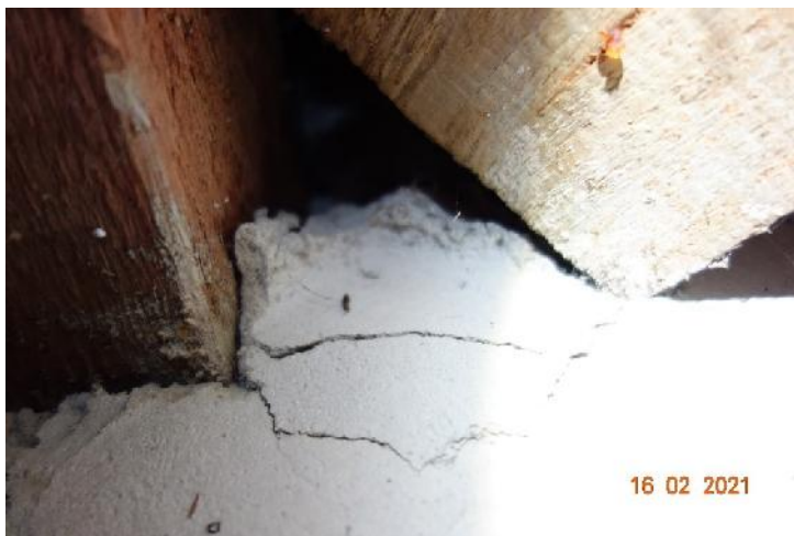
Abbildung 5: Kot innen unter dem Giebel.