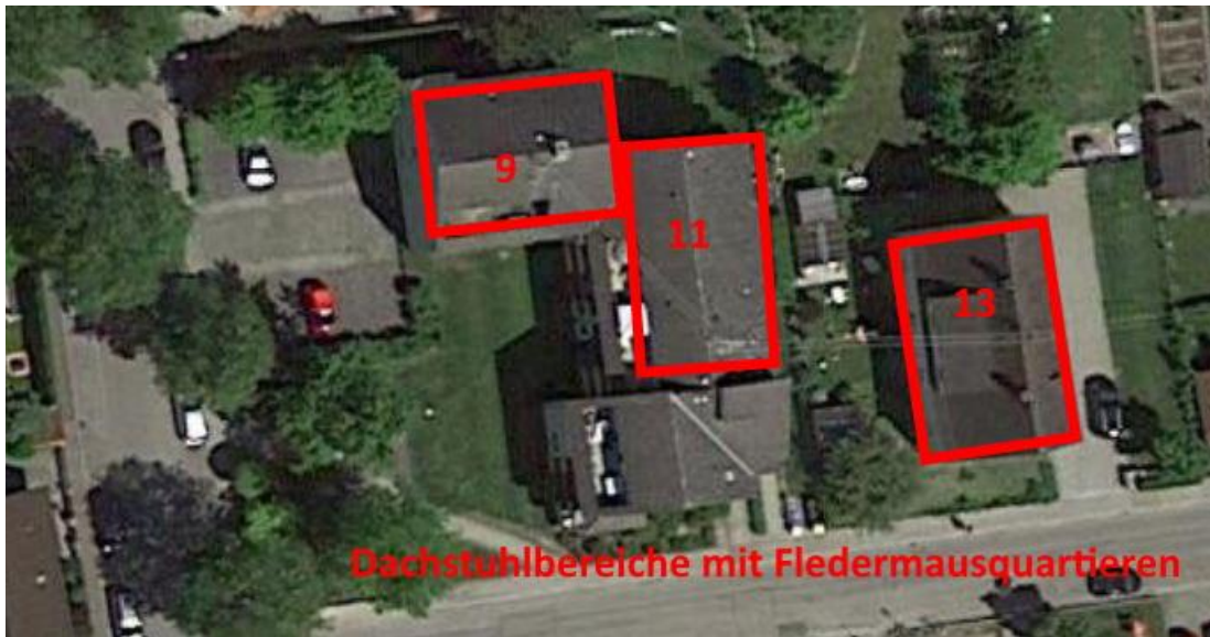
Abbildung 4: Die rot umfassten Dachstühle bzw. Zwischendachbereiche dienen Fledermäusen als Quartier.