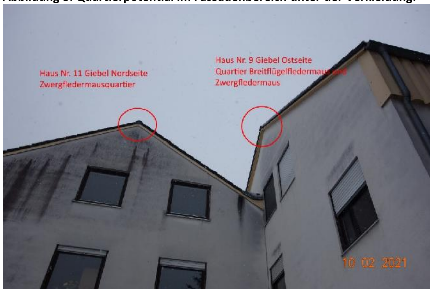
Abbildung 9: Vermutete Aus-/Einflugöffnungen.