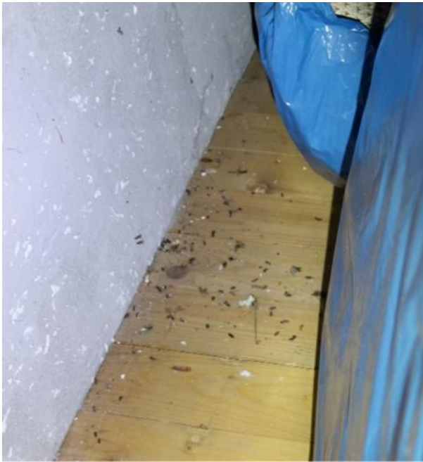
Abbildung 7: Kot einer größeren Fledermausart im Dachstuhl von Haus Nr. 11. Es wird die Breitflügelfledermaus vermutet.