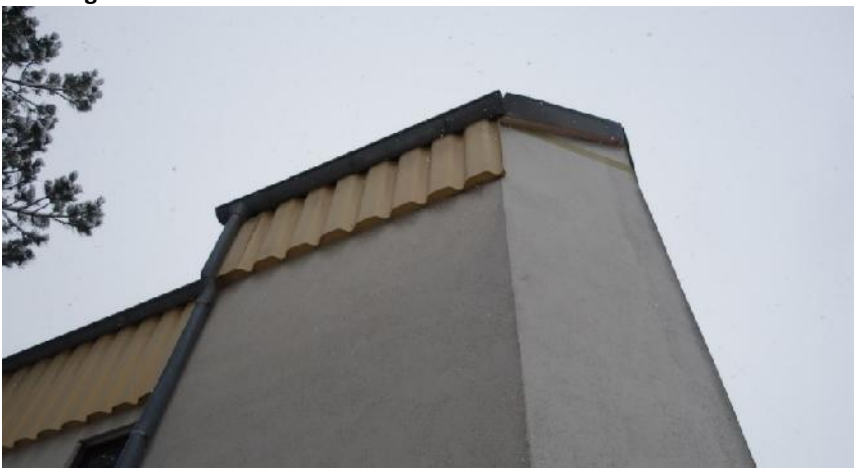
Abbildung 8: Quartierpotential im Fassadenbereich unter der Verkleidung.