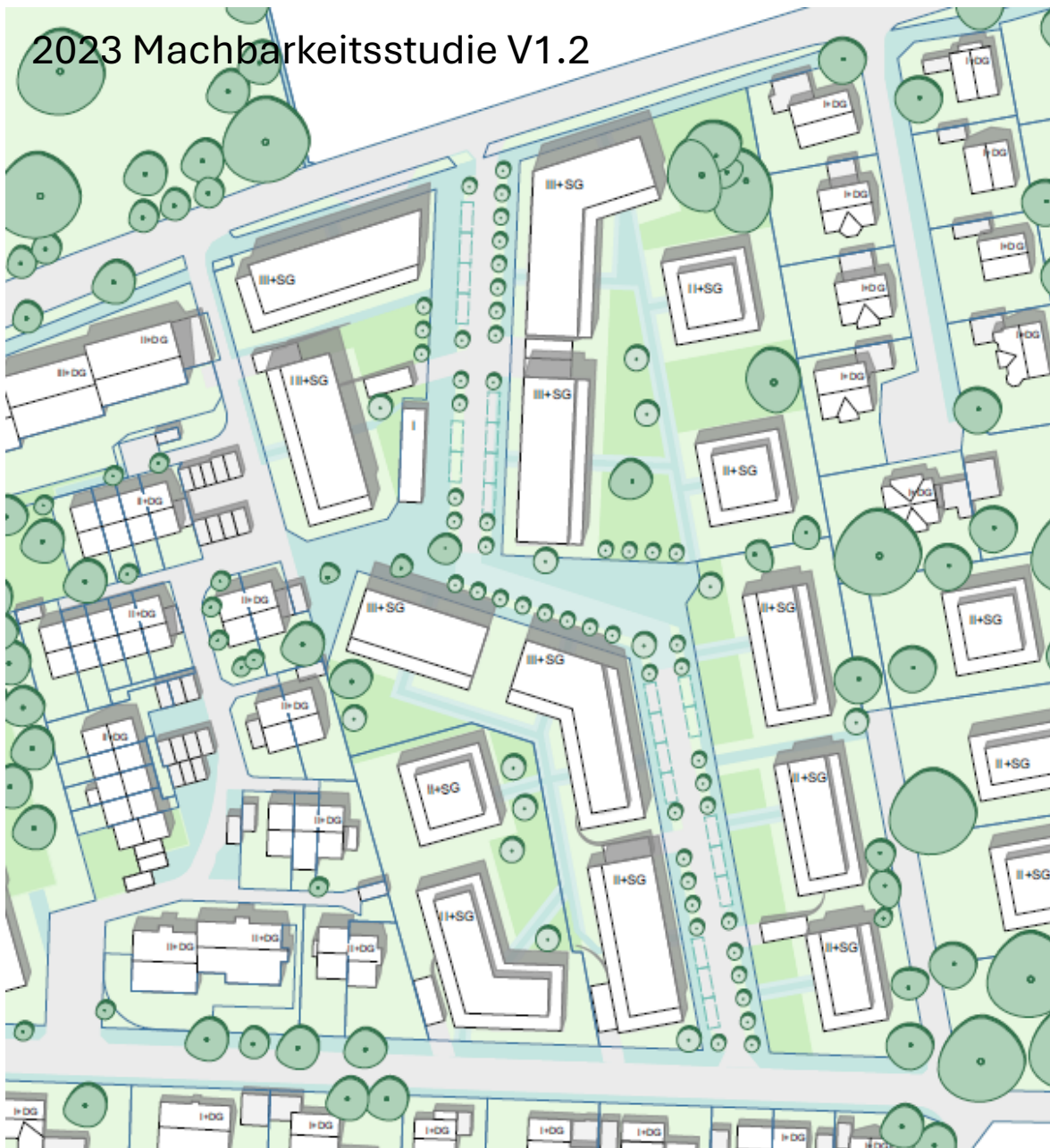
2023 Machbarkeitsstudie V1.2