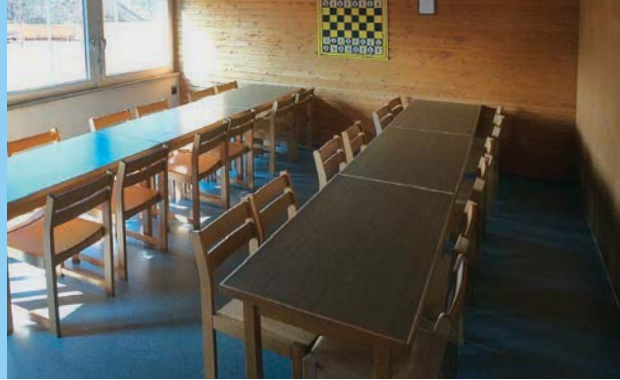
Gruppenraum (30 m 2 ) für kleinere Veranstaltungen