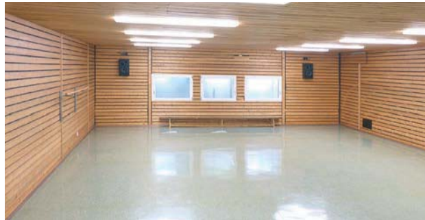
Gymnastikraum (100 m 2 )