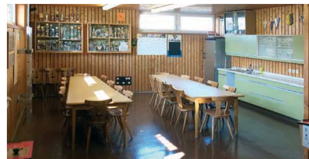
2 Kegelbahnen mit Bewirtungsmöglichkeit

Aktuelle Nutzer im GLZ sind (Stand April 2016): Der SV Friedberg-West, die Schach- und Tischtennisabteilung des Gehörlosensportvereins Augsburg, die Lichtbildfreunde Augsburg, der Gartenbauverein Friedberg-West, die VHS Aichach-Friedberg sowie verschiedene Kegelgruppen.