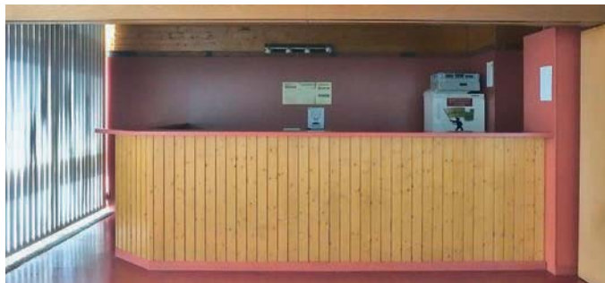
Theke im Saal