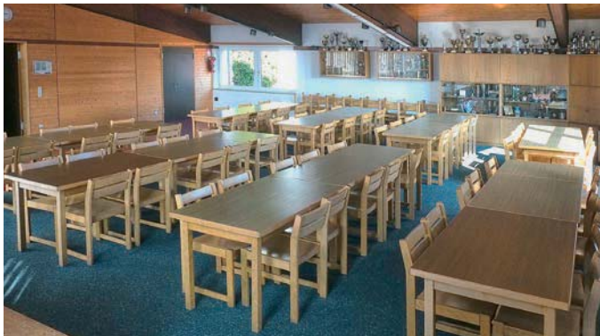
Großer Saal (120 m 2 ) für Versammlungen, Familienfeiern etc.