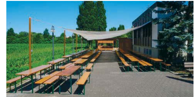
Große Freifläche mit Sonnensegel zur Beschattung

Eine Mutter-Kind-Gruppe wird vormittags an mehreren Wochentagen angeboten.