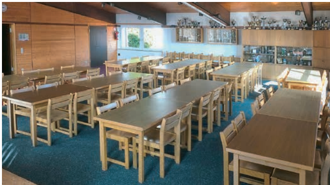
Großer Saal (120 m 2 ) für Versammlungen, Familienfeiern etc.