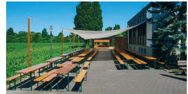
Große Freifläche mit Sonnensegel zur Beschattung

Eine Mutter-Kind-Gruppe wird vormittags an mehreren Wochentagen angeboten.