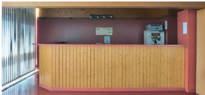
Theke im Saal