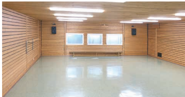
Gymnastikraum (100 m 2 )