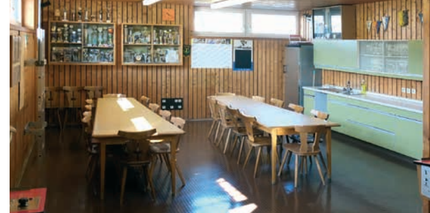
2 Kegelbahnen mit Bewirtungsmöglichkeit

Aktuelle Nutzer im GLZ sind (Stand April 2016): Der SV Friedberg-West, die Schach- und Tischtennisabteilung des Gehörlosensportvereins Augsburg, die Lichtbildfreunde Augsburg, der Gartenbauverein Friedberg-West, die VHS Aichach-Friedberg sowie verschiedene Kegelgruppen.