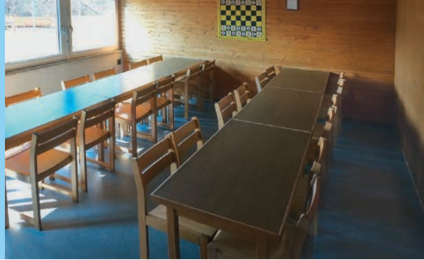
Gruppenraum (30 m 2 ) für kleinere Veranstaltungen